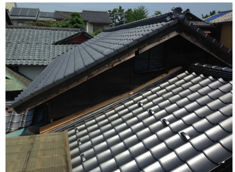
完成した庫裏の屋根

昨年から記事にもしていましたが、相当傷んでおりました庫裏の屋根を修理させていただきました。全額護持会費から支