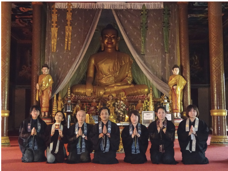
カンボジアのワット・トメイ寺院にて

の日本の生活がなんと有り難いことかを感じました。ラオスのお寺では小学生くらいの男の子から修行をしていて、毎朝6時から全員で托鉢をする姿に尊いものを感じました。貧しくて子供をお寺に預ける人も多く、勉強も頑張れば留学の機会も与えられるそうです。また、メコン川では乾期と雨期で水面の高さが20mも違うとのこと、そんなことを気にしなくても良い九頭竜川（というか日本の川全部）が有り難く感じられました。