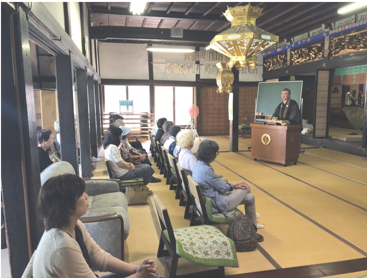
奥田先生の法話を聴聞するみなさま