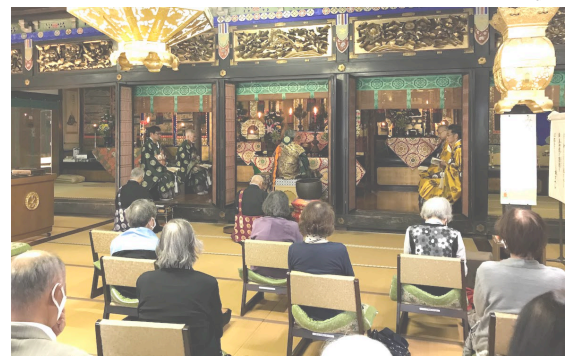
西光寺初の椅子式の法要

仏前と御蝋燭をお供えいただき、本当に有り難うございました。みなさまからの浄財で法要を勤めさせていただきました。そしてお参りくださったみなさま、本当にようこそでございました。みなさまのお参りあつてこそのお寺の法要です。どうかどうかこれからもお待ちしております。この法要を機に、西光寺のお内陣を椅子式にいたしました。ブログを読んでくださっている方やお参りくださった方はすでにご存知のことですが、下手ですが住職がDIYで作りました。費用は八万円ほどかかりましたが、住職個人からお寺への寄進とさせていただきます。詳しくはぜひお寺のブログをご覧ください。悩みながら作成した様子が克明に(しつこく)書かれています。なお、法要後に上映した前住職と前々住職の写真のスライドショーですが、YouTubeに上げてありますので、まだの方はぜひご覧ください。住職が久しぶりにビデオ編集を頑張りました。↓のQRコードをスマートフォンで読み取っていただければご覧いただけます。