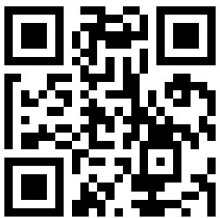
法要スライドショー