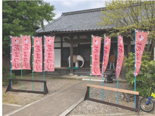
花まつり当日の境内の様子

詳しい行程が発表されたらまたご案内いたしますが、十一月の二十五日〜二十六日に阪北組総代会の研修旅行として、本願寺への念仏奉仕団を企画しております。